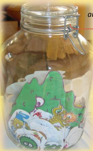
Beim Schätzspiel musste die Anzahl ausgeschnittener Keime erraten werden.