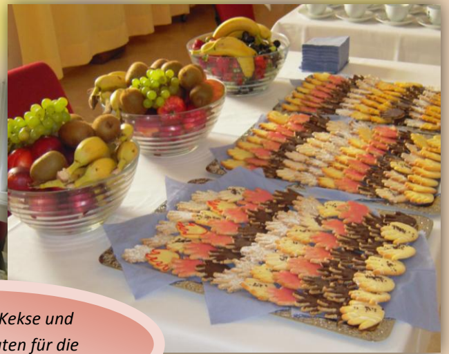
Selbstgemachte Kekse und frisches Obst sorgten für die kulinarische Verpflegung