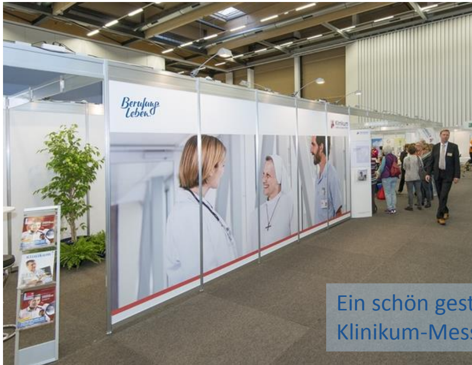
Ein schön gestalteter Klinikum-Messestand