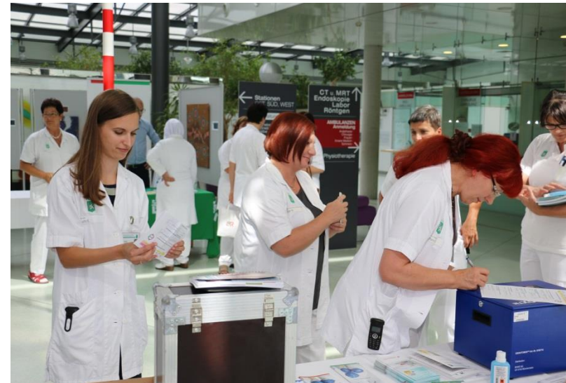
und weit über 100 Besucher