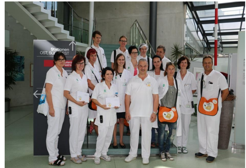
und die Gewinner