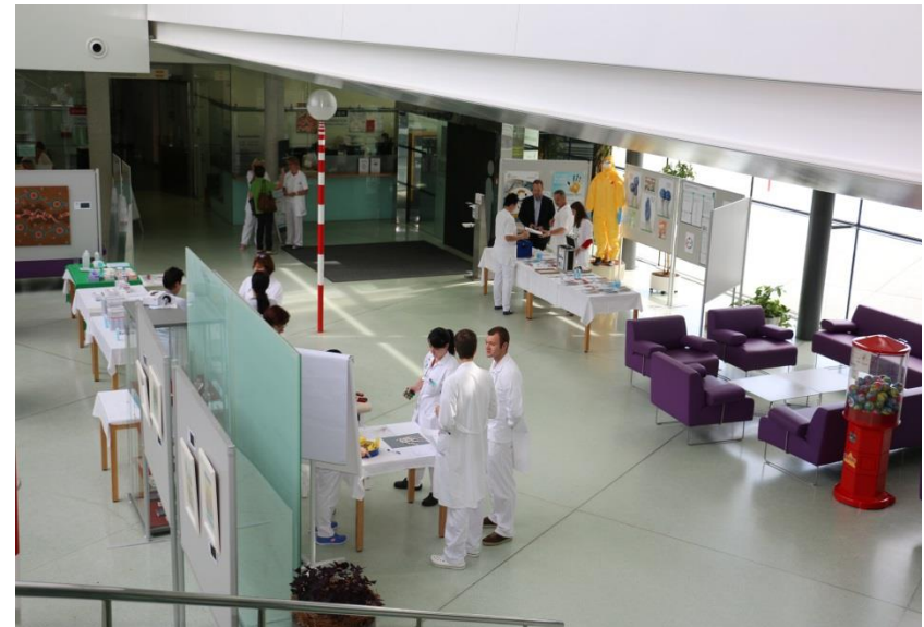
Ein Blick von oben