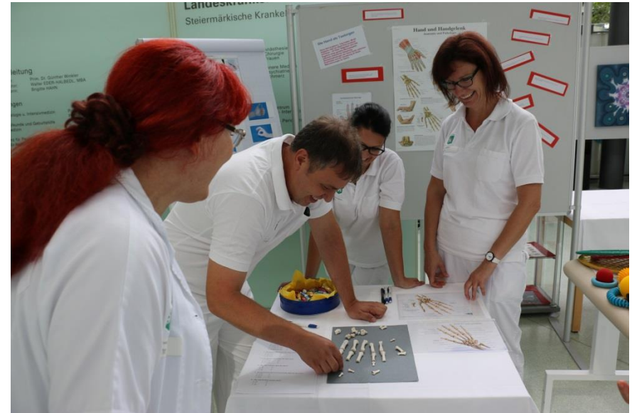
Phys. Therapie präsentierte die Komplexität einer Hand