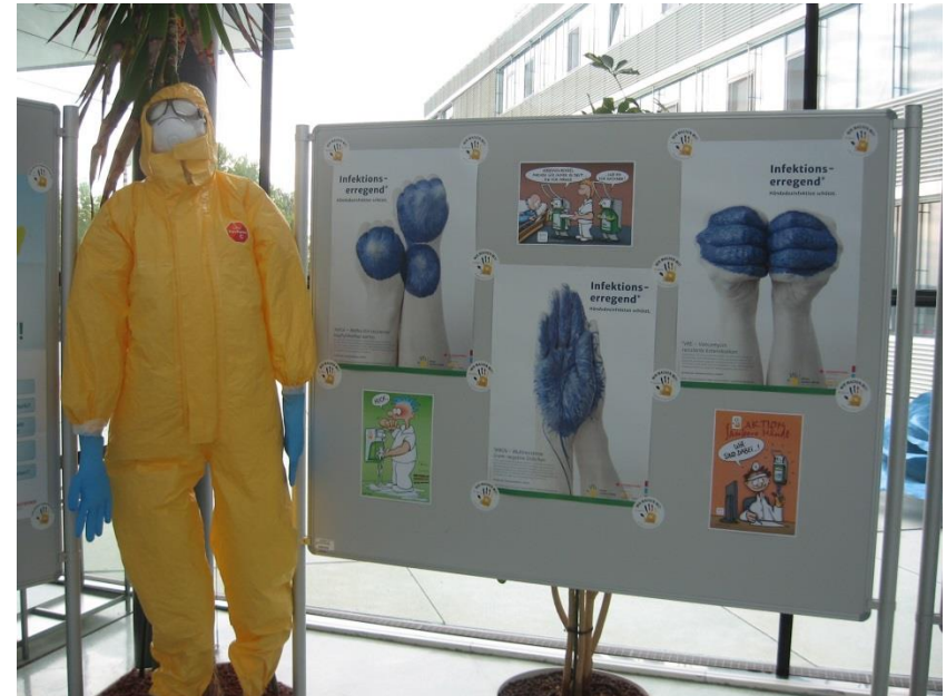
und ein anonymer Mitarbeiter