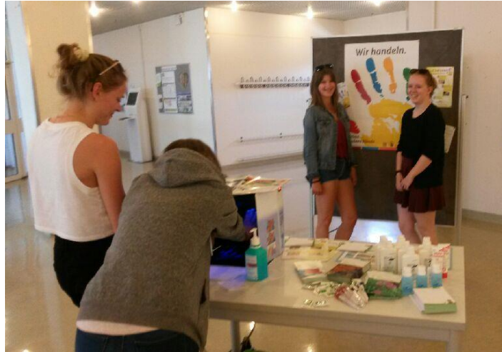
Kinder-Krankenpflege-Schülerinnen besuchen auf dem Weg zur Cafeteria den Aktionstag

Dieses Jahr haben wir für unseren Aktionstag zwei Standorte ausgewählt: