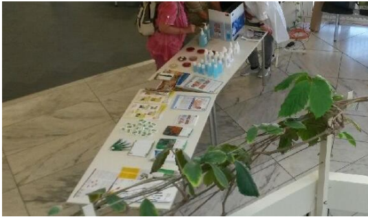
Stand im Treppenhaus, nahe der Aufzüge