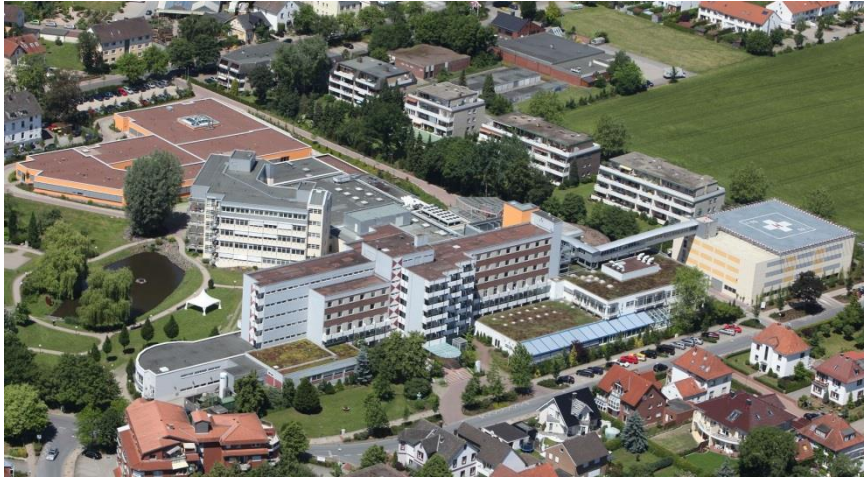
Schüchtermann-Klinik Bad Rothenfelde

Innovative Herausforderungen bahnen sich ihren Weg. Die Aktionstage der ASH sind seit vielen Jahren eine bewährte Tradition in der Schüchtermann-Klinik, einem integrierten Herzzentrum in Bad Rothenfelde am Teutoburger Wald.