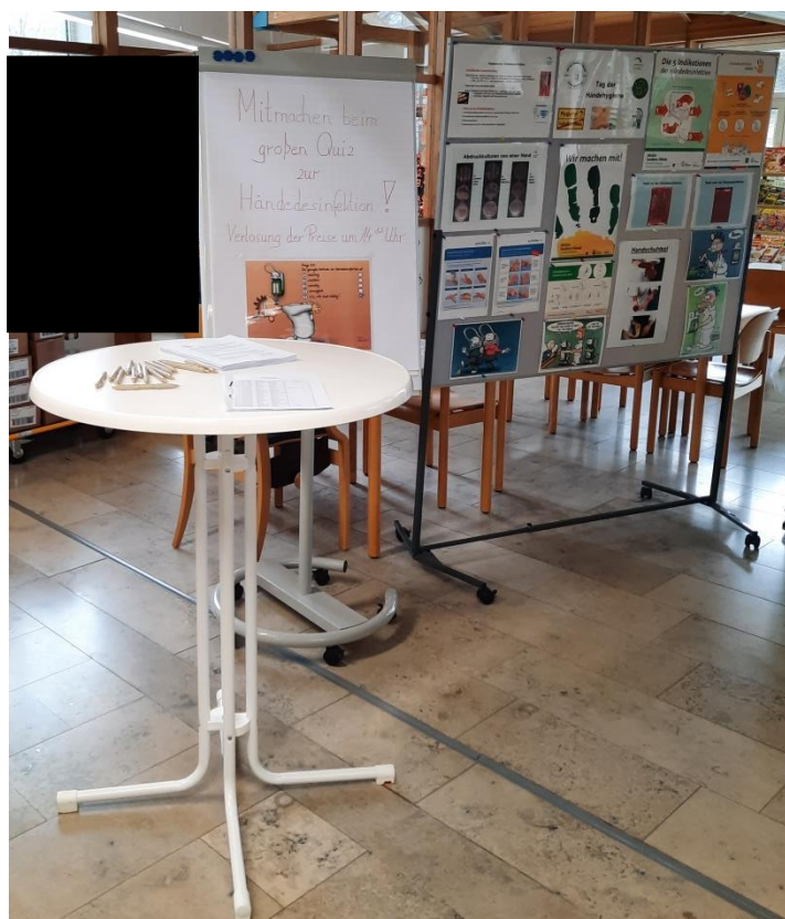
Bild: Krankenhaushygiene und Informationsstand